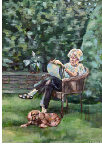
Carolin Beyer „Marie-Luise malt im Garten“, 30x24 cm, Acryl auf Leinwand, 2023