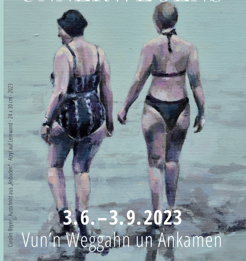
Carolin Beyer: Ausschnitt aus „Anbaden“ · Acryl auf Leinwand · 24 x 30 cm · 2023